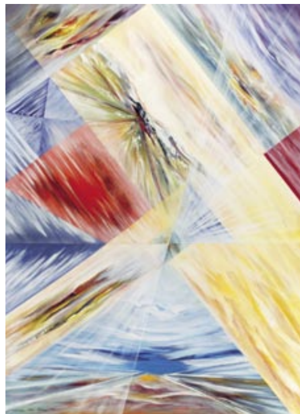
“Development”, 70x96 inch

Rot ist das Symbol konzentrierter Energie. Die Farbspirale wächst. Millionen von Jahre vergehen. Wasser und Land wird sichtbar. Links die Sonne. Aus ihr wird die Erde, symbolisch als Ei, in das Universum geboren und mit tiefem Nachtblau umhüllt.