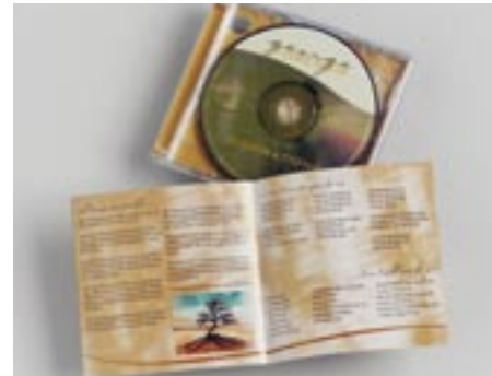
Toni Fritsch Production, USA

»...es macht mich glücklich, dass ich geben kann...« Seit Beginn ihrer Karriere ist es AMM ein großes Anliegen den Menschen zu helfen, die Hilfe benötigen. Seit ihrer ersten Ausstellung in Houston im April 2004 unterstützt sie die St. Joseph Hospital Foundation.