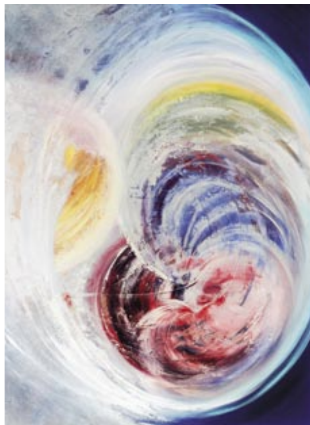
“The Birth of the Earth”, 70x96 inch